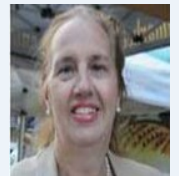
La Presidenta del Condado de Manhattan Gale Brewer