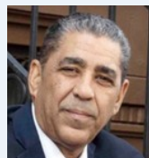
Congresista NY-13 Adriano Espaillat